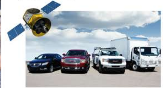
أسطول المركبات تحت السيطرة