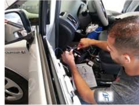
التركيب من قبل فنيين مختصين

التنوع في خيارات الخرائط المستخدمة ونوعيتها وتعدد الخصائص لتسهيل وتوضيح الإستخدام